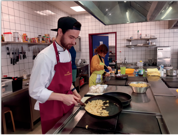
ALTMARKJUGEND- MEISTERSCHAFTEN DER GASTRONOMIE